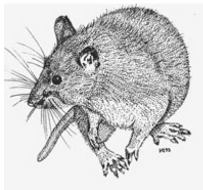
Tegning: Karl-Martin Vagn Jensen

Rotten er ret altædende, men foretrækker normalt kornprodukter. Den æder daglig en fødemængde, der svarer til ca. 1/10 af dens egen legemsvægt. I modsætning til mus, som klarer sig fint på helt tørre steder, skal rotten have adgang til drikkevand. Rotten klatrer og svømmer udmærket, men dens vigtigste redskaber er dog de store, mejselformede fortænder, som kan gnave i alt, der er mindre hårdt end jern - hvis bare tænderne kan få fat.